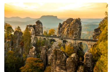
Nationalpark Sächsische Schweiz